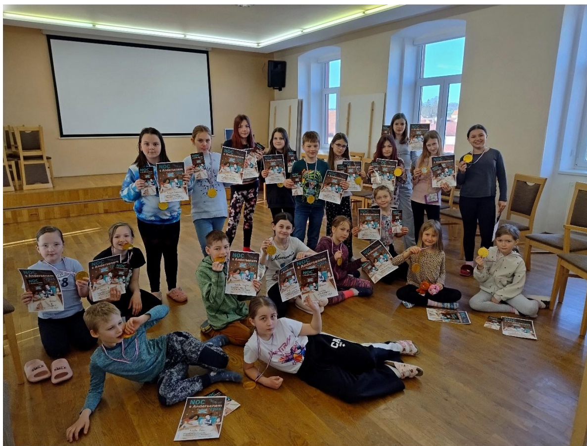
Obecní knihovna Kasejovice