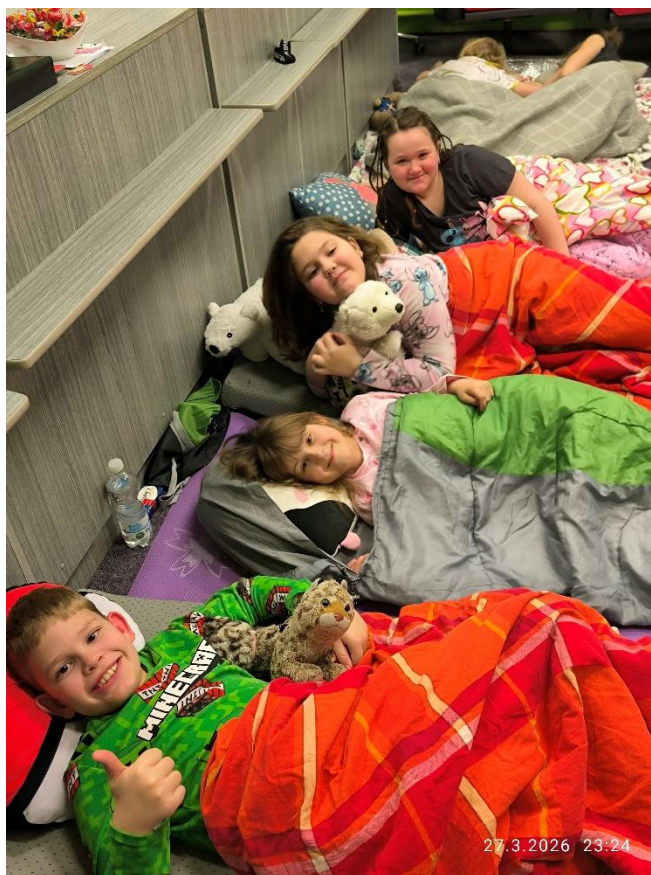
Městská knihovna Lom