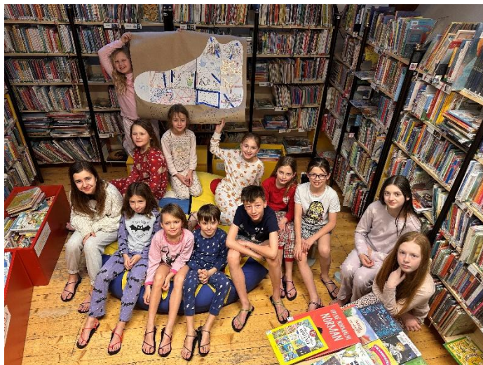
Knihovna Bedřicha Beneše Buchlovana v Uherském Hradišti