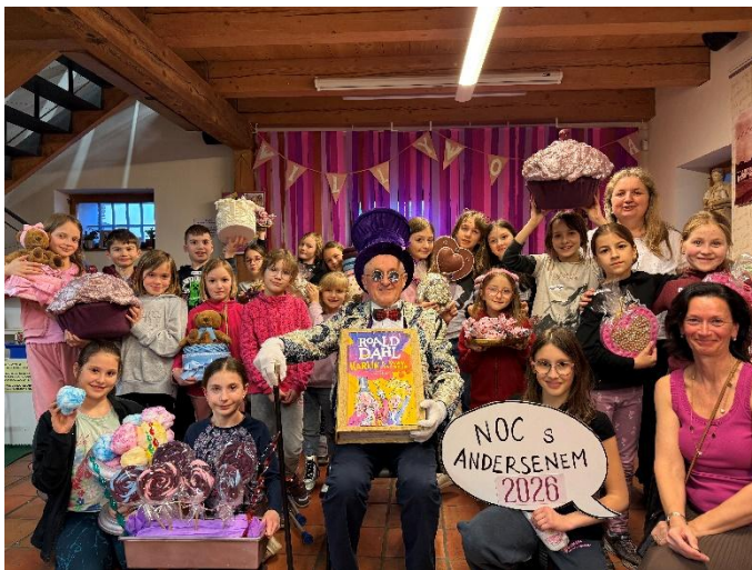
Knihovna Praha – Dolní Chabry