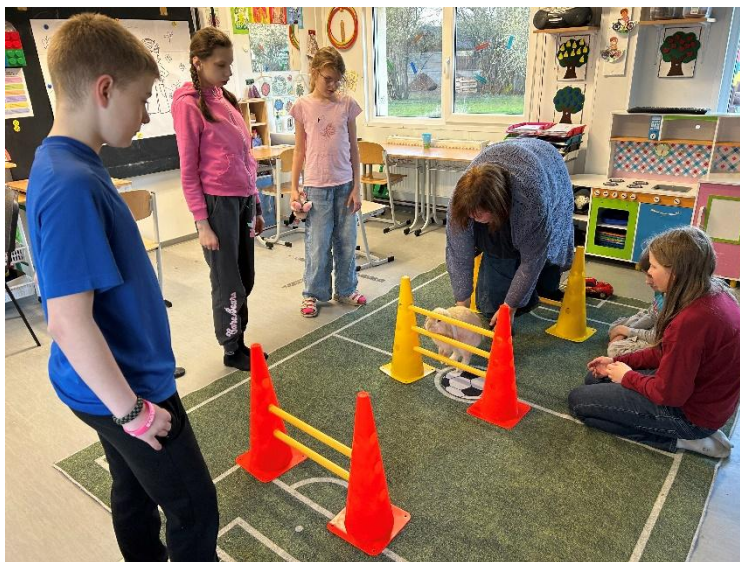
ZŠ a PŠ Neratovice