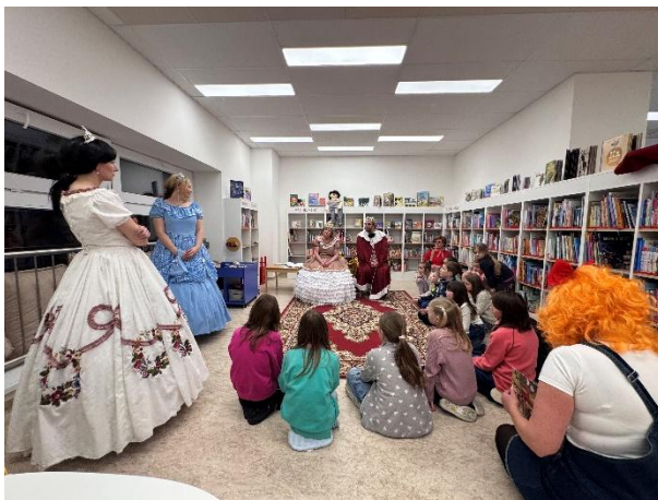
Městská knihovna Valašské Meziříčí

ale hned několik - pro každého jeden. Celý večer jsme zakončili oficiální znělkou Noci s Andersenem, dětem byl předán nalezený prstýnek a pamětní list na skvěle prožité kouzelný večer. Děkujeme Miloši Macourkovi, že jsme mohli prožít jeho příběhy, které po letech stále baví děti i nás dospělé.“