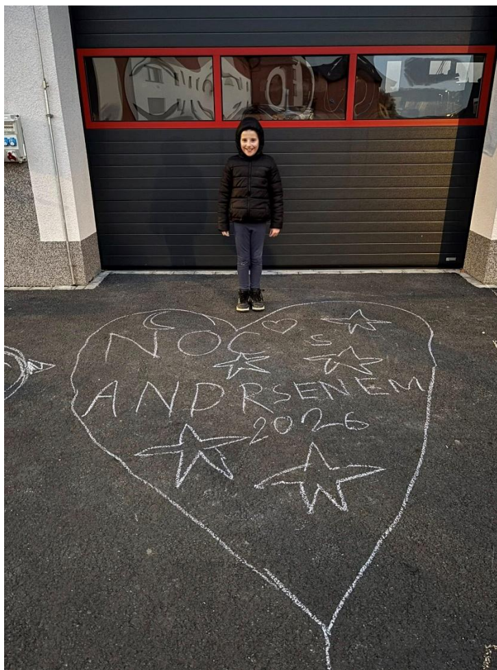
Dolany u Klatov