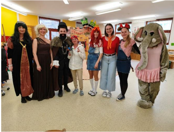
Mateřská škola Seifertova Jihlava

Arabely. Děti si vyrobily například jednoduchou „brnkačku“ pro princeznu Xenii, vytvořily vlastní pohádkové kulisy a nechybělo ani hledání ukrytého Fantomase v prostorách knihovny. Součástí programu bylo také zasetí hrášku strýčka Pompa, který si děti odnesly domů jako připomínku akce.“