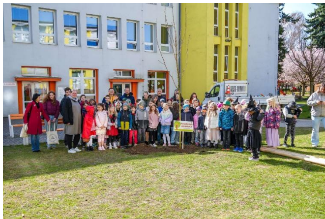
Městská knihovna Kolín