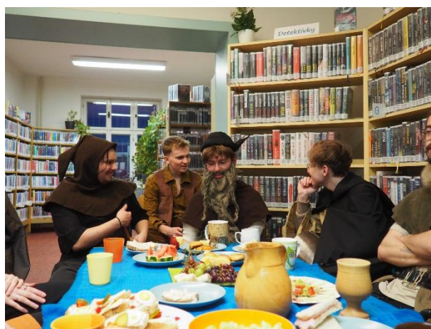
Hradec Králové, pobočka Kukleny